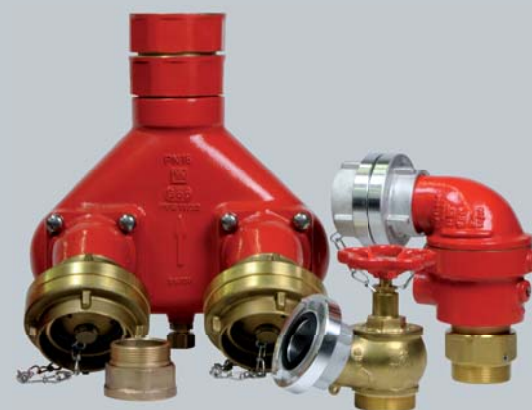
Beispiele unserer Armaturen für den vorbeugenden Brandschutz

examples of our building supply fittings