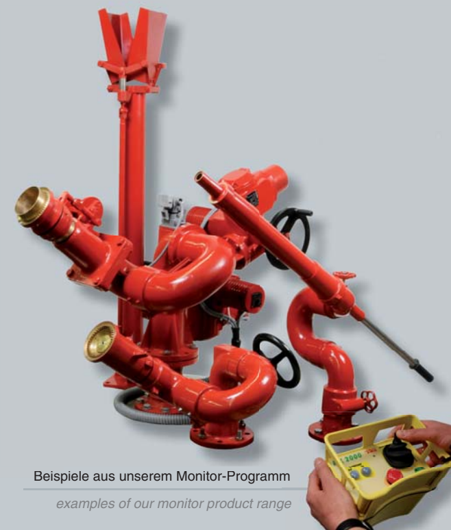
Beispiele aus unserem Monitor-Programm