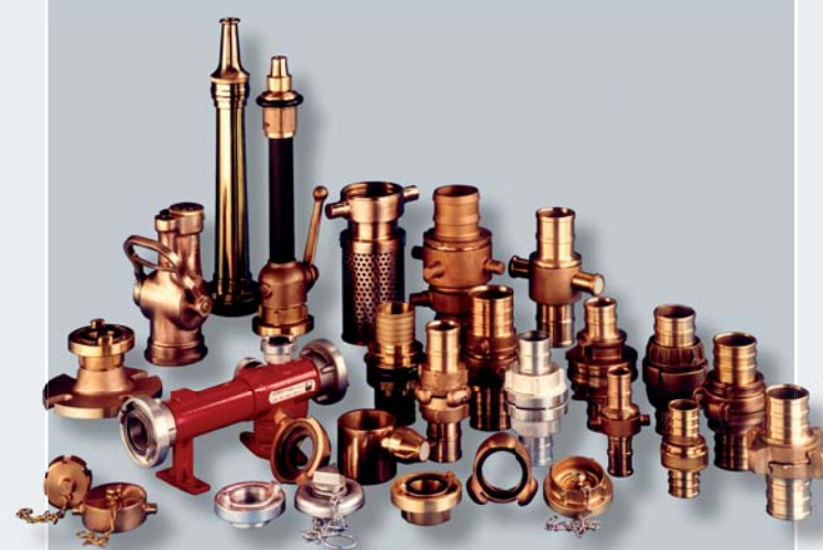
Auszug aus unserem Feuerlösch-Programm

Our branchpipes and nozzles are available with all coupling systems.