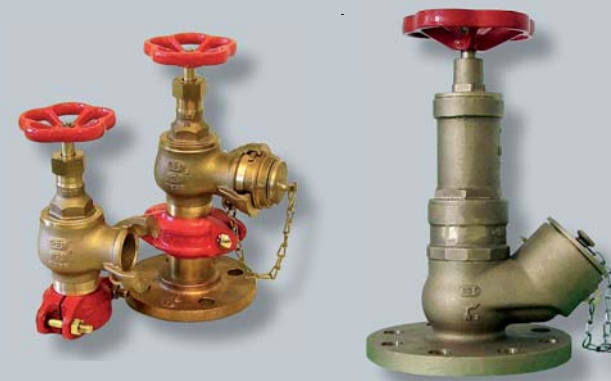
individuelle Produktlösungen nach Kundenwunsch

overview of our fire fighting product range