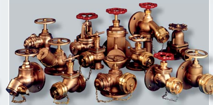
Auszug aus unserem Schlauchanschlußventil-Programm

examples of our building supply fittings